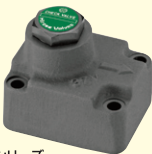
HGC-421 1NLシリーズ ガスケット取付形チェックバルブ