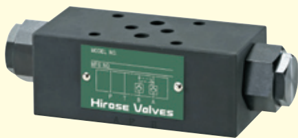
HMPCシリーズ モジュラー形パイロットチェックバルブ