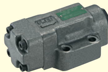
HPCZシリーズ ガスケット取付形パイロットチェックバルブ